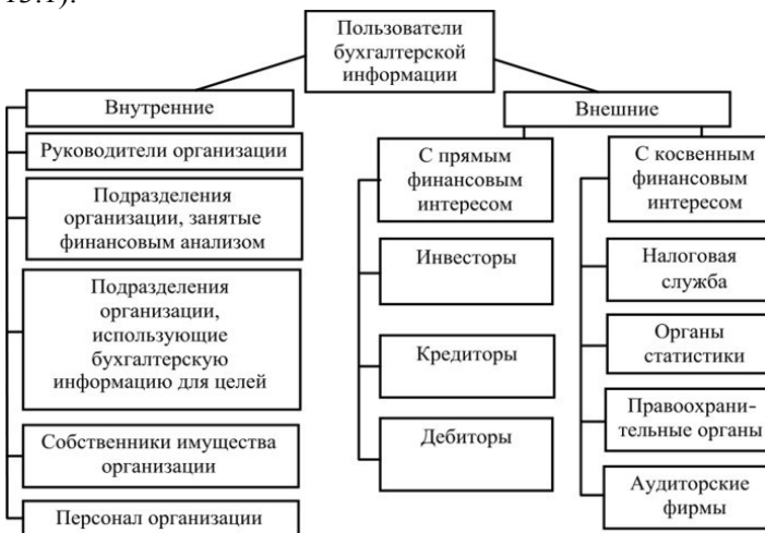
Рис. 13.1. Состав внутренних и внешних пользователей бухгалтерской отчетности

Физические и юридические лица, являющиеся пользователями информации, содержащейся в бухгалтерской отчетности, условно делятся на две основные группы – внутренние и внешние (рис. 13.1).