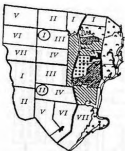
Рис. 2. Варианты проектирования полей

Иллюстрации (диаграммы, графики, схемы, фотографии) обозначаются словом «Рис.» и нумеруются последовательно арабскими цифрами сквозной нумерацией и его наименование располагают посередине строки, например: