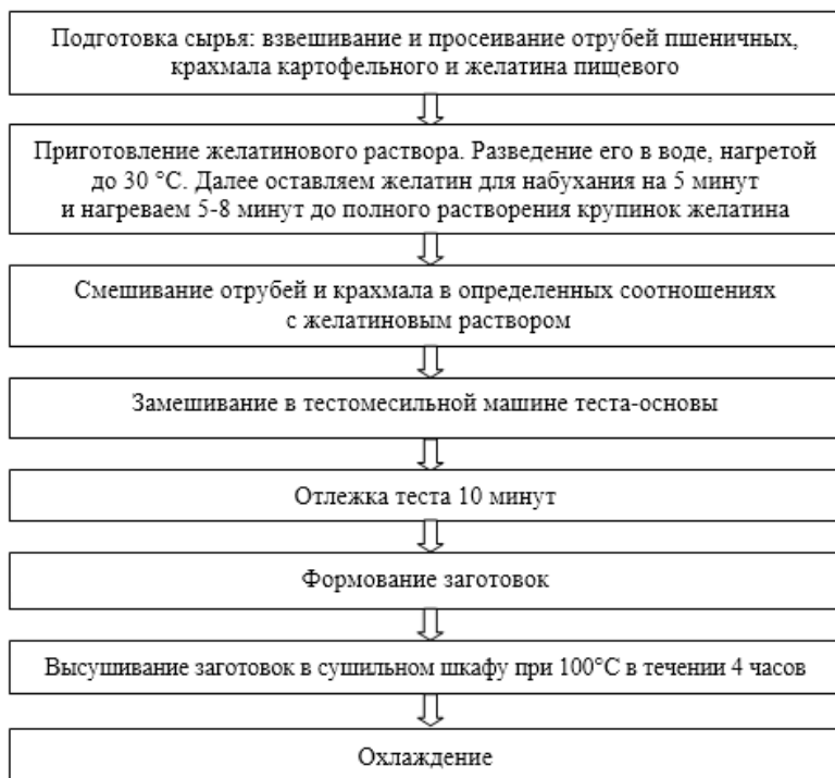
Рис. 1. Технологическая схема производства биоразлагаемой одноразовой упаковки на основе отходов мукомольного производства

Предлагаемый технологический процесс производства биоразлагаемой одноразовой упаковки из вторичного сырья и растительных компонентов должен осуществляться согласно схеме, представленной на рисунке 1.