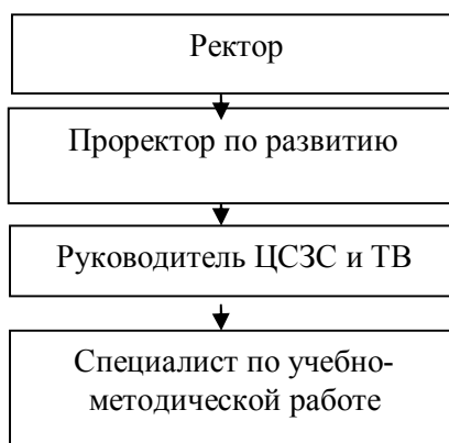
Схема организационной структуры ЦСЗС и ТВ