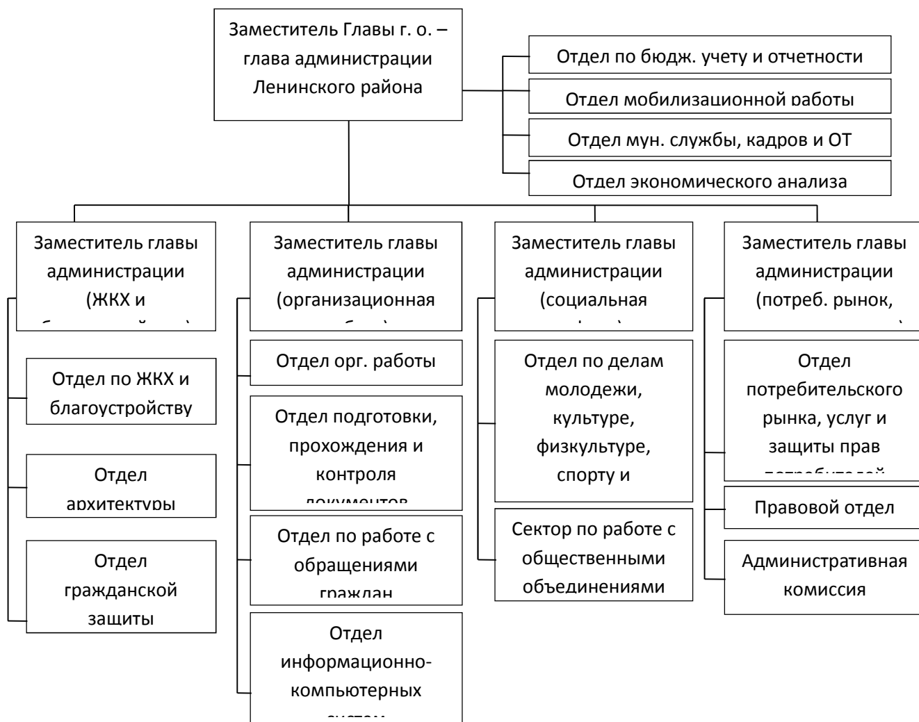
Рисунок 3 – Схема организационной структуры администрации Ленинского района городского округа Самара