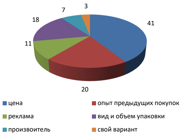
Рис. 1. Показатели, влияющие на выбор потребителей при покупке шампуня для волос, %