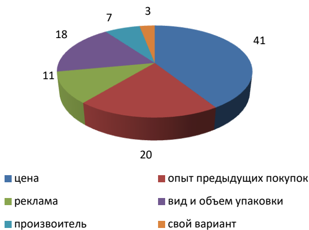
Рис. 1. Показатели, влияющие на выбор потребителей при покупке шампуня для волос, %