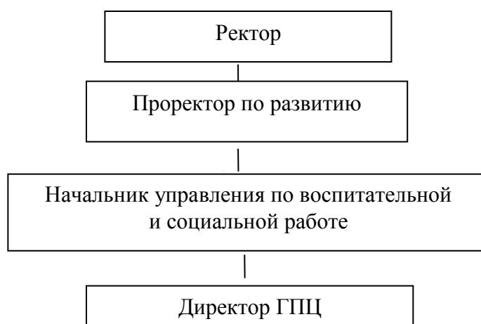
Схема организационной структуры ГПЦ