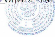
График предварительной защиты и защиты выпускных квалификационных работ слушателями групп профессиональной переподготовки