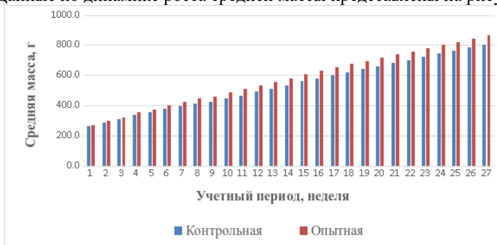
Рисунок 2 - Динамика роста средней массы.

Данные по динамике роста средней массы представлены на рисунке 2.